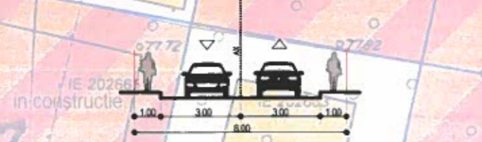
PROFIL PROPUS A-A' DRUMUL DEALUL CUCULUI - SC. 1:200